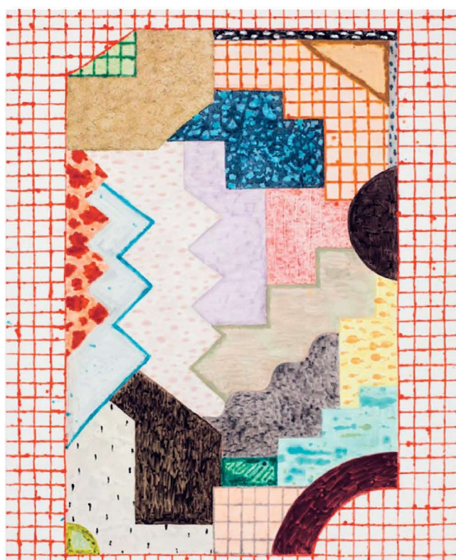
Untitled (#02-12) van Rebecca Morris.